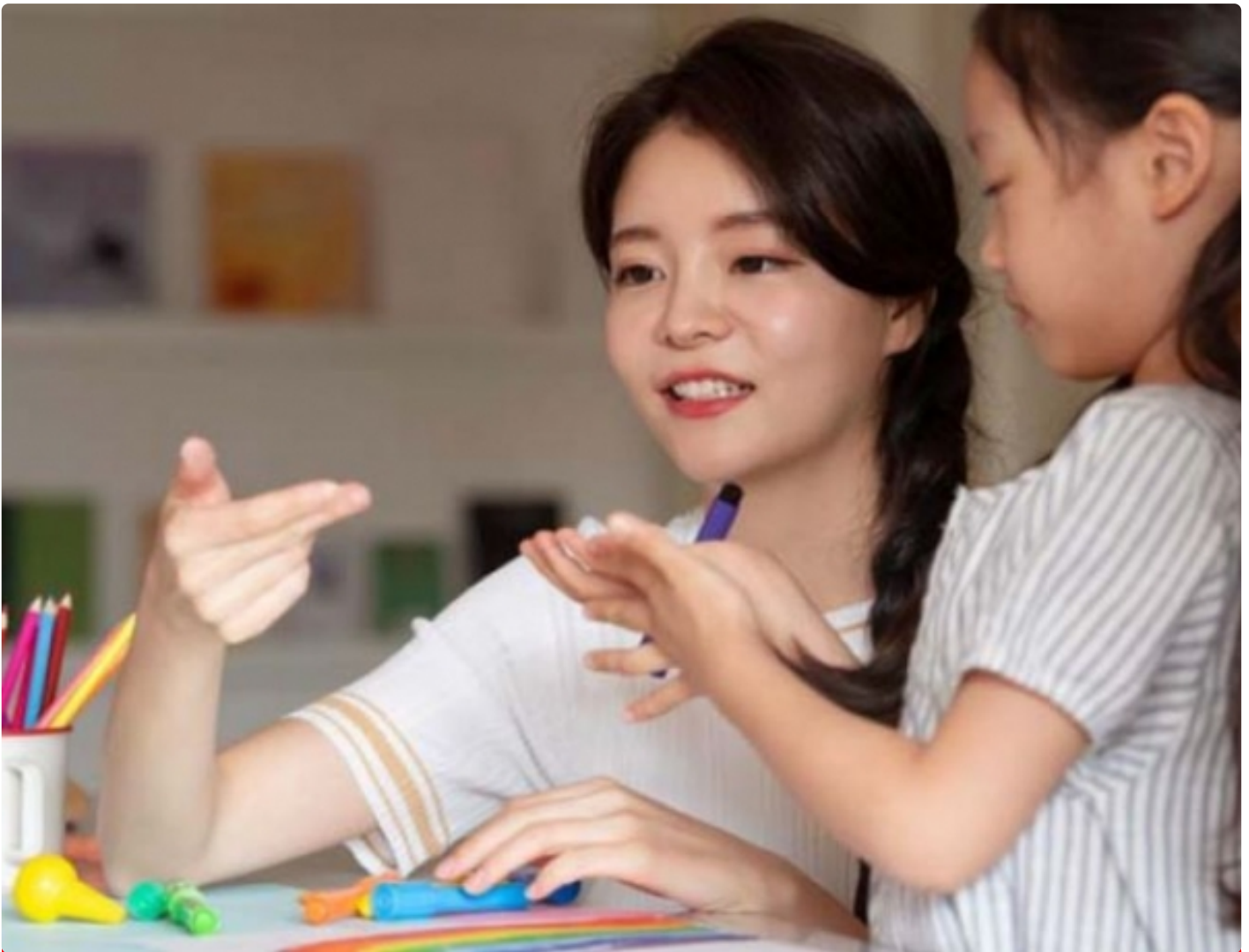
Ilustrasi: Pengasuhan anak